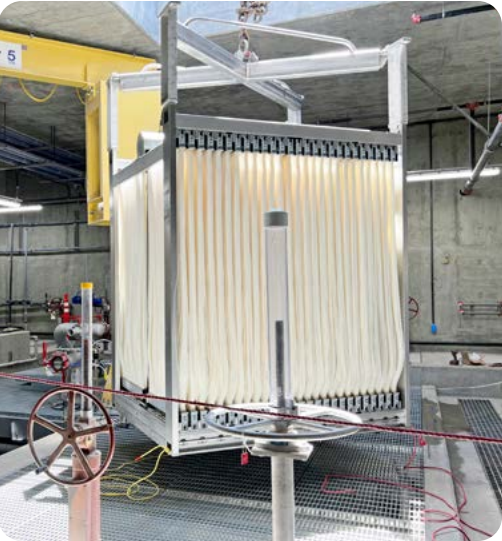
Sistema de ultrafiltración levantado sobre la superficie en el SWIP

Un componente clave del Plan Maestro de Agua Sostenible de la Ciudad destinado a reducir la dependencia de la Ciudad de los suministros de agua importados está a punto de completarse. El Proyecto de Infraestructura de Agua Sostenible, o SWIP (por sus siglas en inglés), entró en funcionamiento en el otoño de 2022 y agrega un suministro de agua sostenible y resistente a la sequía a la cartera de suministro de agua de la Ciudad. En la superficie, el SWIP puede parecer un estacionamiento en el Centro Cívico de la Ciudad, pero debajo de la superficie hay un nuevo tanque de recolección de aguas pluviales de 1.5 millones de galones y una nueva instalación avanzada de tratamiento de agua de 1 millón de galones por día que convertirá las aguas pluviales y residuales en agua purificada que se utilizará para irrigación, edificios con doble plomería y para recargar nuestra cuenca de agua subterránea local. El SWIP utiliza un proceso de purificación de agua de seis pasos que comienza con la eliminación de sólidos grandes y su tratamiento biológico seguido de múltiples pasos de filtración usando ultrafiltración, cartuchos de filtración y ósmosis inversa antes de desinfectarla mediante oxidación avanzada con luz ultravioleta y desinfección con cloro libre. El agua purificada del SWIP no solo cumple con los estándares de reciclaje de agua, sino que también supera todas las regulaciones de agua potable para recargar nuestra cuenca de agua subterránea.