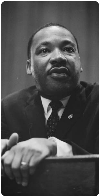
Martin Luther King conferencia de prensa/MST., 1964. Fotografía. loc.gov/item/2003688129.

16 de enero de 2023, de 9 am. a 10:30 a.m. Centro de artes escénicas de la escuela secundaria John Adams (2425 16th St.) Se requieren mascarillas. mlkjrwestside.org