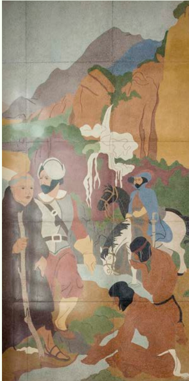
Detalle del mural, Foto por Kenneth Lopez, Meztli Projects, 2023

La mayoría está de acuerdo en que el panel noroeste incluye representaciones de un monje franciscano (muy probablemente el padre Serra); un hombre con casco (posiblemente Gaspar de Portola); una figura a caballo (que podría representar el periodo español o una prolongación de la expedición de Portola); unas cascadas (quizás los manantiales de Kuruvungna); y las dos figuras de la parte inferior derecha, que se supone que son indígenas.