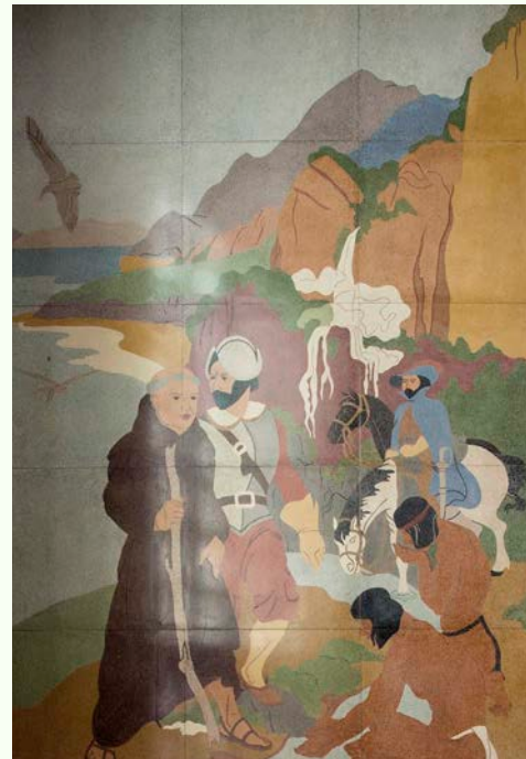
Detalles del mural “Historia de Santa Mónica y el Distrito de la Bahía” de Stanton Macdonald-Wright, 1939. Panel suroeste mostrado a la izquierda, el panel noroeste se muestra a la derecha; fotos por Kenneth Lopez, Meztlí Projects, 2023

Historia de Santa Mónica y del distrito de la bahía es un mural de “petracromo” (similar al terrazo) instalado en las paredes interiores del vestíbulo del edificio del Municipio de Santa Mónica, diseñado por Stanton Macdonald-Wright, un artista estadounidense que pasó sus primeros años en Santa Mónica. El mural fue encargado a través del Proyecto Federal de Arte de la Administración para el Progreso de las Obras (WPA). Macdonald-Wright también actuó como administrador de la división del proyecto WPA en el sur de California, supervisando a otros numerosos artistas y sus proyectos. El mural de Macdonald-Wright se terminó en 1939 junto con el propio edificio. La ciudad de Santa Mónica es propietaria del mural y forma parte de la colección de arte público de la ciudad. El Municipio de Santa Mónica fue declarado monumento histórico en 1979 y el mural fue mencionado en la designación. En 2011, el exterior del Municipio recibió una designación suplementaria de monumento histórico.