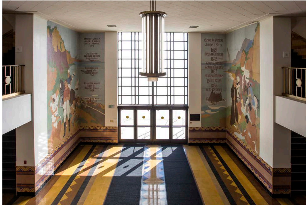
Municipio de la Ciudad de Santa Mónica

Utiliza las hojas de trabajo de las páginas siguientes para reflexionar sobre las imágenes del mural e imaginar posibles respuestas.